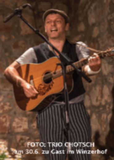
FOTO: TRIO CHOTSCH am 30.6. zu Gast im Winzerhof